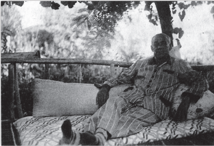
Sarayköyde, dağda - 1951