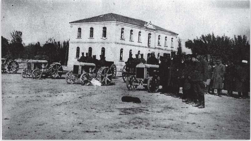
Sarayköy Askerlik Şubesi - 1925