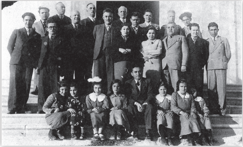
Bir bayramda okul ziyaretinde