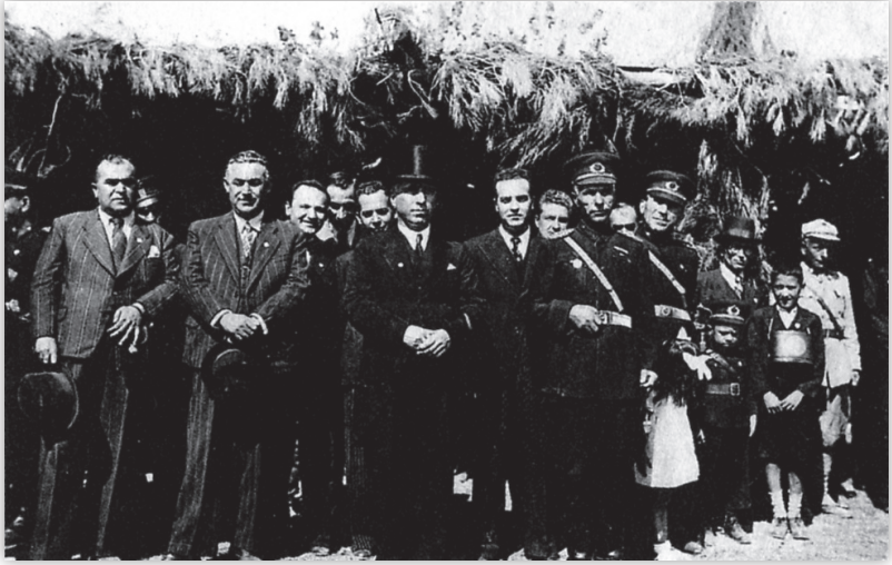
Bir tören sırasında