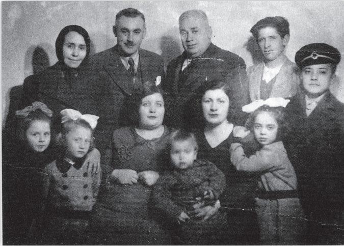
Bir aile fotoğrafı - 1939. Ayakta soldan ikinci